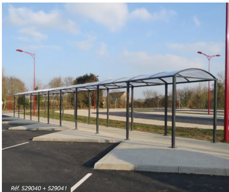
Réf. 529040 + 529041