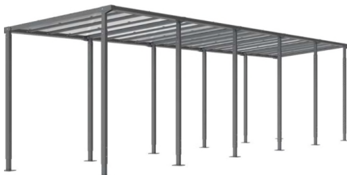
■ Réf. 529255 + 529256