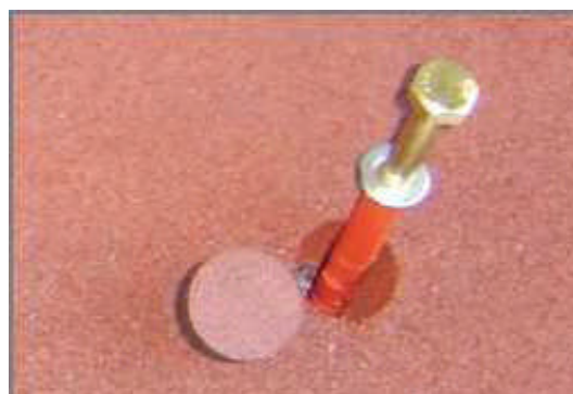
Set de fixation

La pose se fait directement sur une chaussée propre, sans préparation spécifique préalable. La rapidité de mise en œuvre permet une immobilisation minimum de la chaussée (2 à 3 heures).